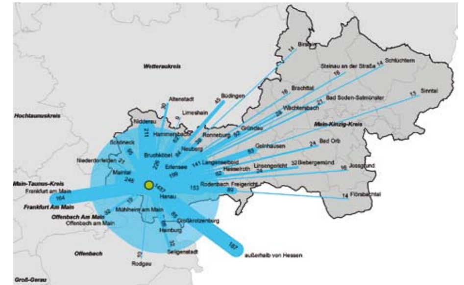
Herkunft der Schüler/innen an den Schulen in Hanau

Da Berufsschulen im Vergleich zu bislang im Rahmen des Schulischen Mobilitätsmanagements der ivm betrachteten Schulen eine Reihe von Spezifika aufweisen, kommt diesem Projekt ein besonderer Pilotcharakter zu. Um nähere Erkenntnisse zum Mobilitätsverhalten der Schüler an der Eugen-Kaiser-Schule sowie den Kaufmännischen Schulen Ha-